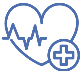
Gestes et soins d'urgences