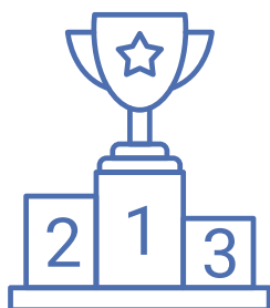
Préparation concours IADE/IBODE