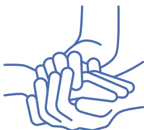
Soins et prise en charge du patient