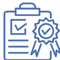
Qualité / Certification HAS